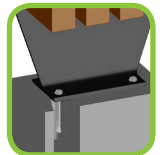
Detalle de anclaje